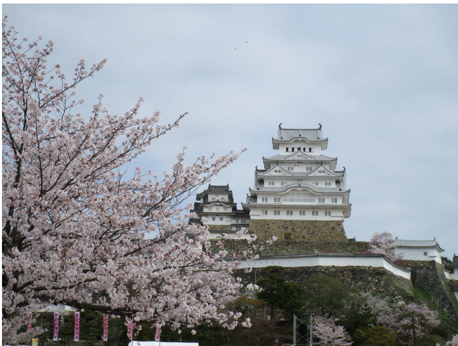
(la 4an de aprilo 2015)